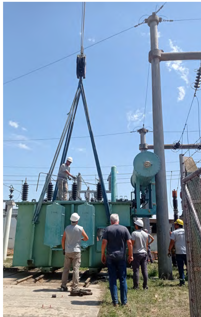
Conferencia de Prensa brindada el 7 de diciembre:

Gracias a la colaboración de las empresas de la localidad que autogeneraron energía y a los vecinos que minimizaron el consumo, logramos que el sistema no se saturara y siguiera funcionando hasta salir de la emergencia.