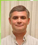
OLIVA, Germán Presidente

Durante la primera reunión del Consejo de Administración realizada después de la Asamblea, se realizó la distribución de cargos y el Consejo quedó conformado de la siguiente manera: