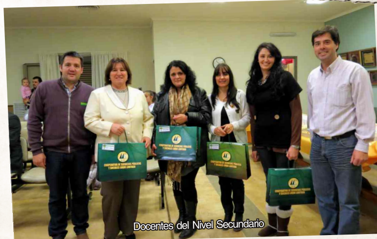
Docentes del Nivel Secundario