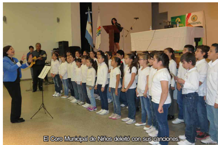
El Coro Municipal de Niños deleitó con sus canciones.

Finalmente, cabe destacar también que, en la conferencia de prensa previa al inicio de la charla, Pigna destacó la importancia de la historia en la educación de nuestros niños y jóvenes, ya que “la historia es un bien social”, que nos ayuda a comprender el presente y nos da herramientas para el futuro. Además, resaltó que el Cooperativismo es una de las alternativas para cambiar la sociedad individualista actual, ya que es un modelo político y económico que se opone al capitalismo salvaje .