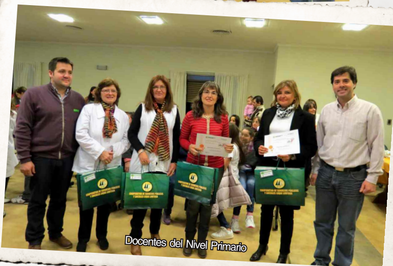
Docentes del Nivel Primario