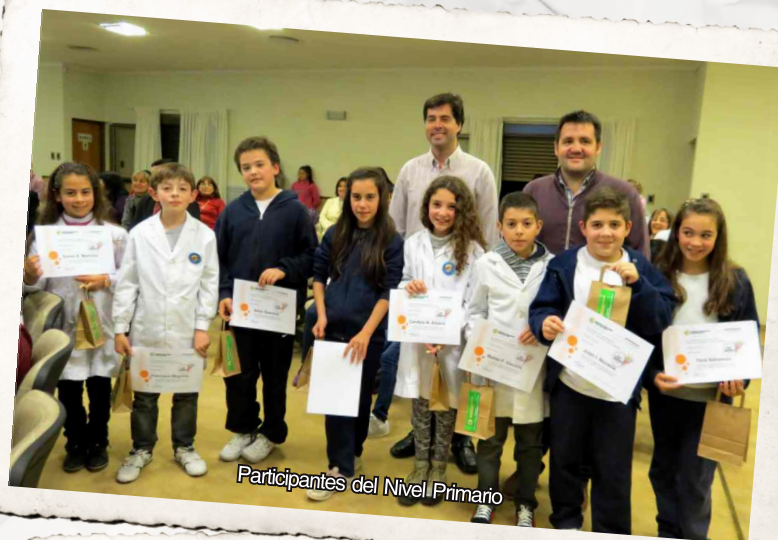
Participantes del Nivel Primario

Finalmente, un agradecimiento especial al Coro Municipal de Niños , porque su actuación siempre le da un toque especial al evento.