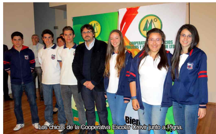
Los chicos de la Cooperativa Escolar Crecer Junto a Pigna.

Para cerrar su disertación, Pigna Eligió una frase que pronunció en 1878 Alejo Peyret, dirigente socialista y pionero del cooperativismo en la Argentina: “Amaos los unos a los otros, dice el Evangelio. Pero no basta amarse: es necesario unirse, entenderse y asociarse para sobrellevar con más facilidad la carga de la vida. La fe transporta las montañas e inunda los valles, dice también el Evangelio. ¿Cuál es esta fe todopoderosa? Es la fe de la solidaridad social, de la fraternidad humana” .