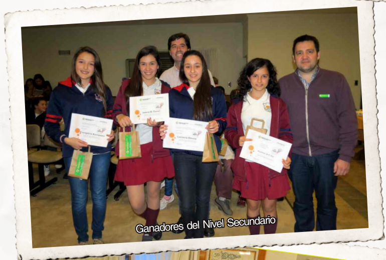
Ganadores del Nivel Secundario