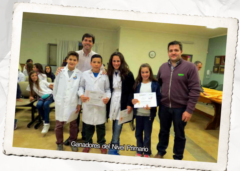
Ganadores del Nivel Primario