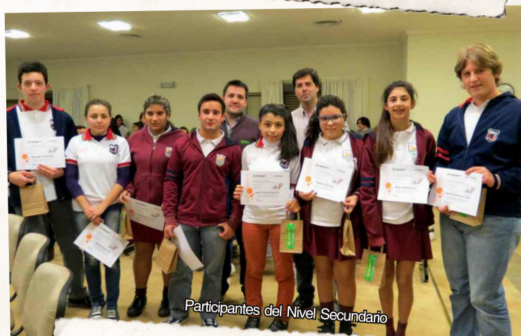
Participantes del Nivel Secundario