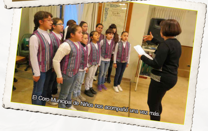
El Coro Municipal de Niños nos acompañó una vez más.