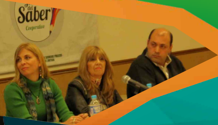
Fomentando el Cooperativismo