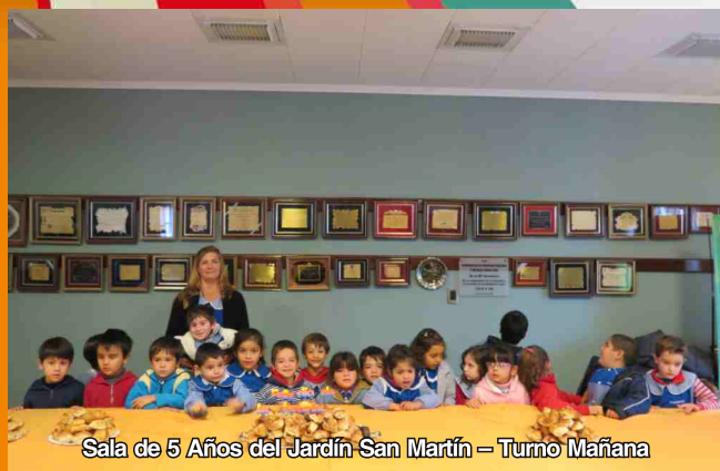
Sala de 5 Años del Jardín San Martín – Turno Mañana

Con este evento, intentamos agasajar a los más pequeños de nuestra comunidad, acercándolos un poco más a nuestra música nacional, de una manera diferente, acorde a su edad. Muchas gracias a todos ellos, a sus papás que los trajeron y a las señoras que los acompañaron y nos ayudaron a atenderlos.