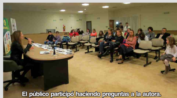
El público participó haciendo preguntas a la autora.