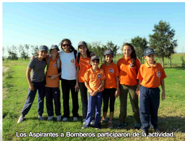
Los Aspirantes a Bomberos participaron de la actividad.