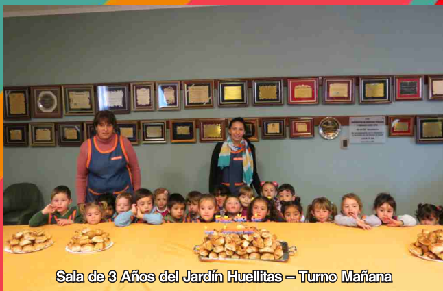
Sala de 3 Años del Jardín Huellitas – Turno Mañana