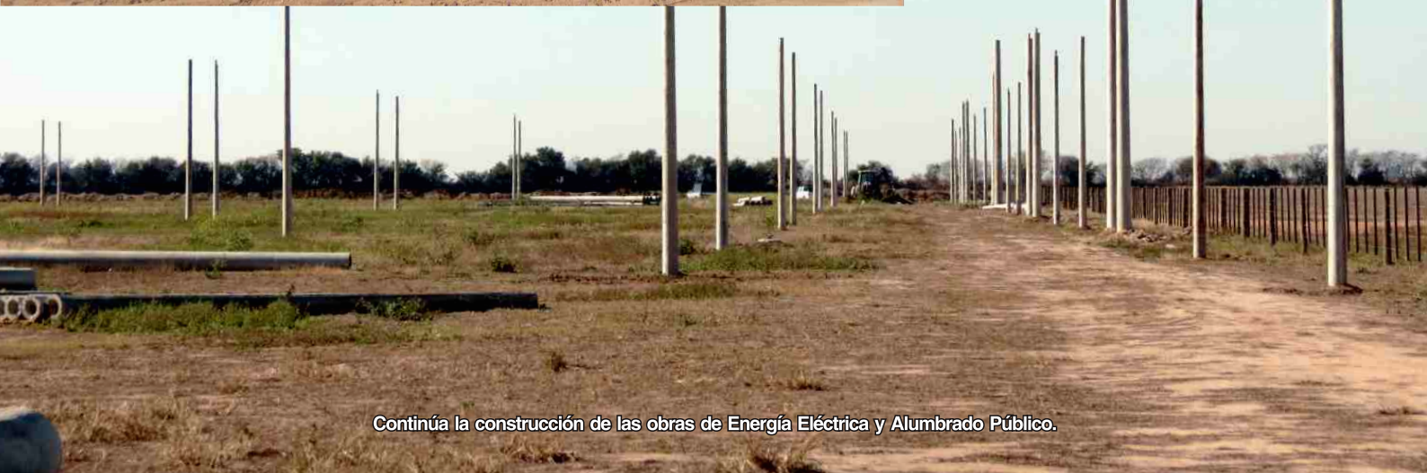
Continúa la construcción de las obras de Energía Eléctrica y Alumbrado Público.

En este sentido, cabe destacar que la obra de Agua se finalizó en el mes de abril, mientras que avanza la construcción del resto de las obras. Por último, es importante mencionar que todos estos trabajos se realizan con mano de obra propia de la Cooperativa.