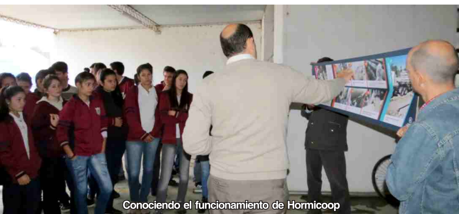
Conociendo el funcionamiento de Hormicoop

El miércoles 14 y jueves 15 de mayo recibimos la visita de los chicos de 4º año del IPET N° 300 y del Instituto Secundario Dr. Raúl Loza, quienes recorrieron todas las dependencias de la Cooperativa, para conocer en detalle cada uno de los servicios. Estos alumnos son los que participarán en la Justa del Saber Cooperativo 2014 que se realizará en Julio, con motivo del Día del Cooperativismo.