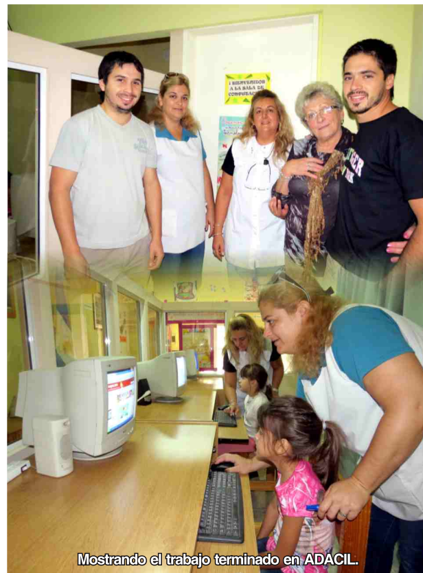
Mostrando el trabajo terminado en ADACIL.