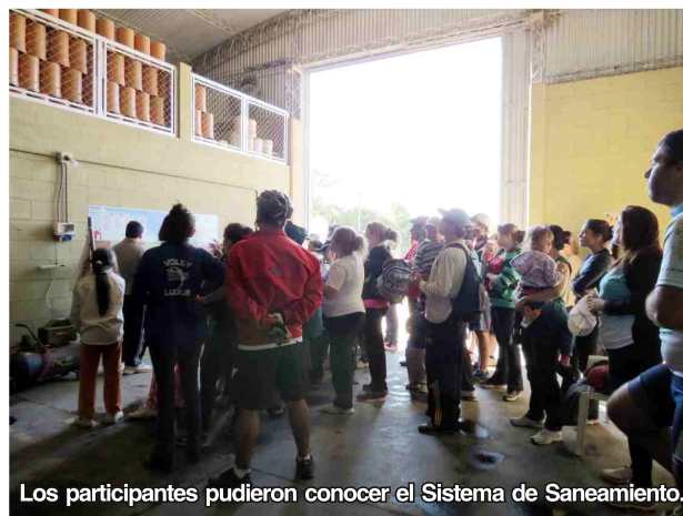
Los participantes pudieron conocer el Sistema de Saneamiento.

Muchas gracias a todos los que hicieron posible que esta actividad pudiera realizarse: a los organizadores, a los participantes, al Servicio de Ambulancia de la Cooperativa, a los Inspectores de Tránsito Municipales, y a la Policía de Capilla del Carmen y de Luque que nos acompañaron durante el recorrido para resguardar la seguridad de todos.