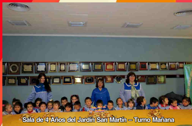
Sala de 4 Años del Jardín San Martín – Turno Mañana