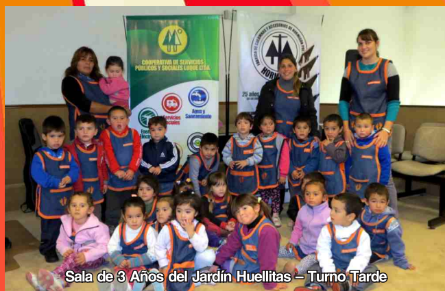
Sala de 3 Años del Jardín Huellitas – Turno Tarde