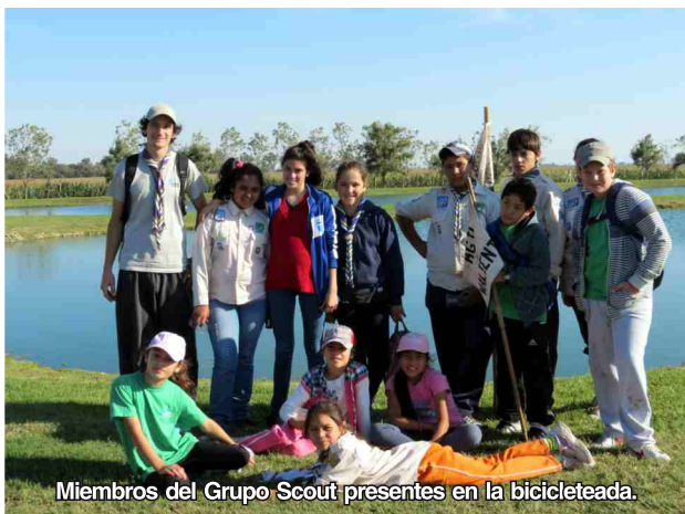
Miembros del Grupo Scout presentes en la bicicleteada.

Más de 50 personas participaron el sábado 26 de abril de la 1ra Bicicleteada a la Planta de Tratamiento de Efluentes, con un recorrido total de 20 kilómetros.