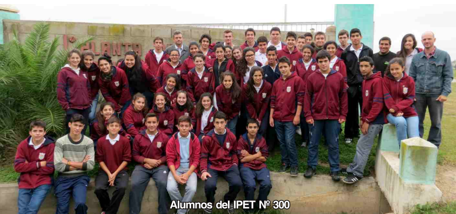
Alumnos del IPET N° 300