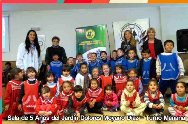
Sala de 5 Años del Jardín Dolores Moyano Díaz – Turno Mañana