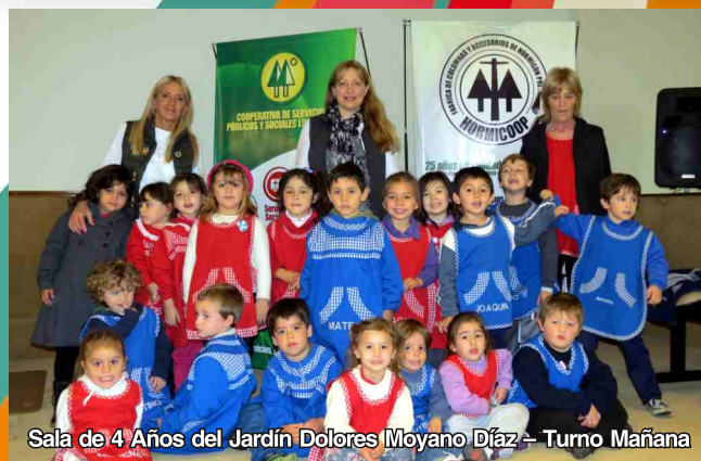
Sala de 4 Años del Jardín Dolores Moyano Díaz – Turno Mañana