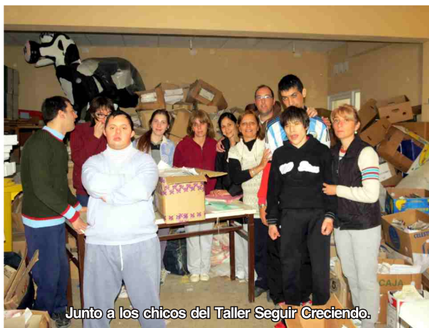
Junto a los chicos del Taller Seguir Creciendo.