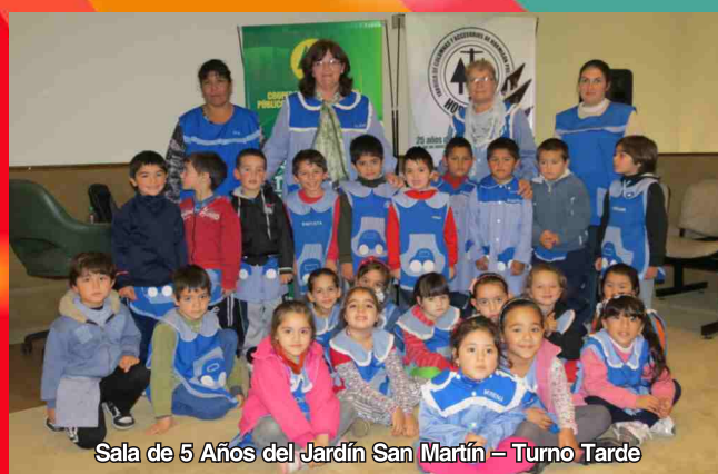
Sala de 5 Años del Jardín San Martín – Turno Tarde