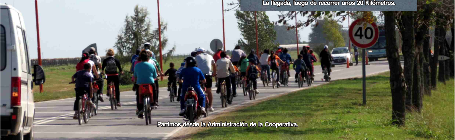
Partimos desde la Administración de la Cooperativa.