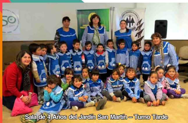
Sala de 4 Años del Jardín San Martín – Turno Tarde