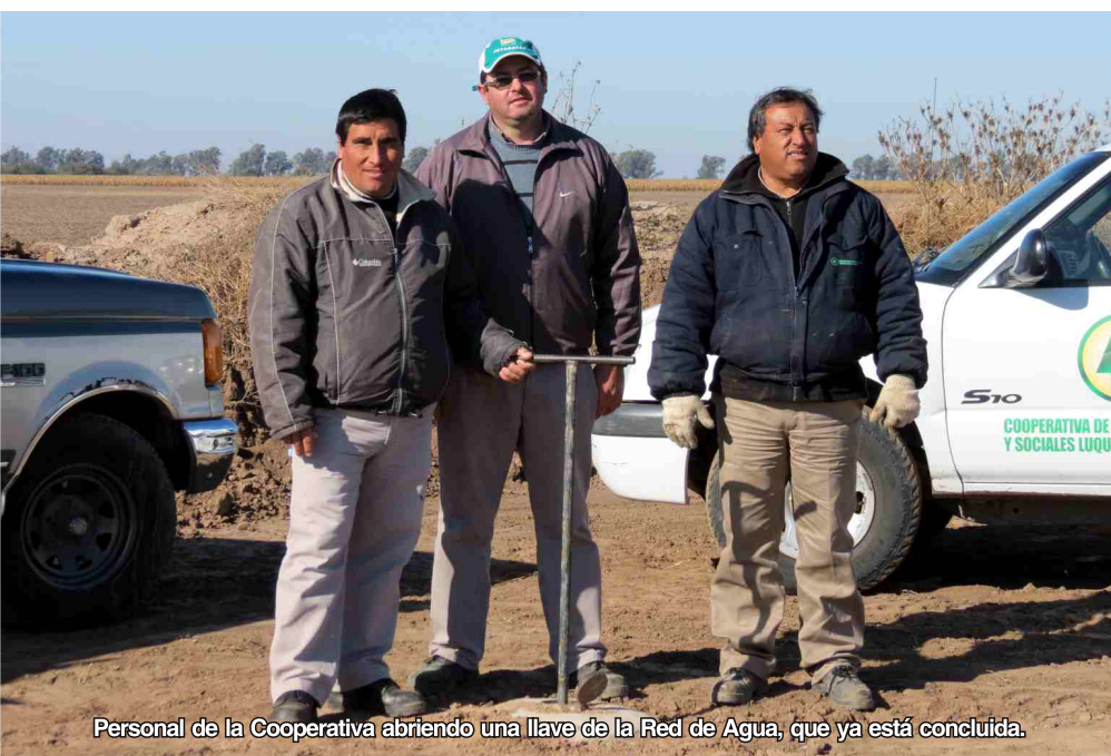
Personal de la Cooperativa abriendo una llave de la Red de Agua, que ya está concluida.