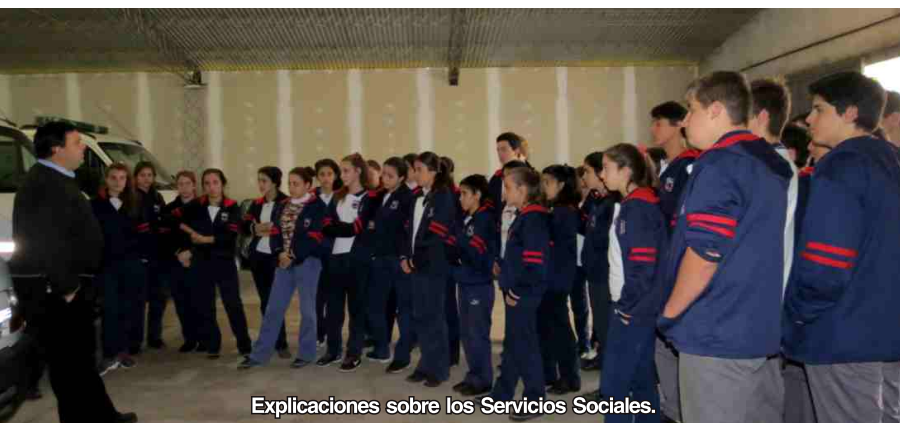
Explicaciones sobre los Servicios Sociales.