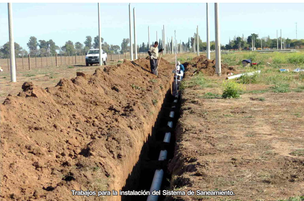
Trabajos para la instalación del Sistema de Saneamiento.