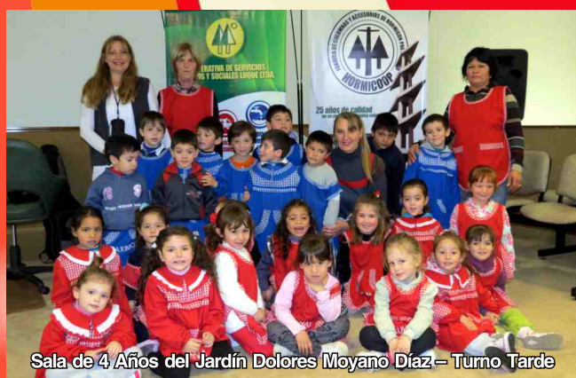
Sala de 4 Años del Jardín Dolores Moyano Díaz – Turno Tarde