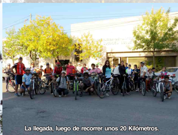
La llegada, luego de recorrer unos 20 Kilómetros.