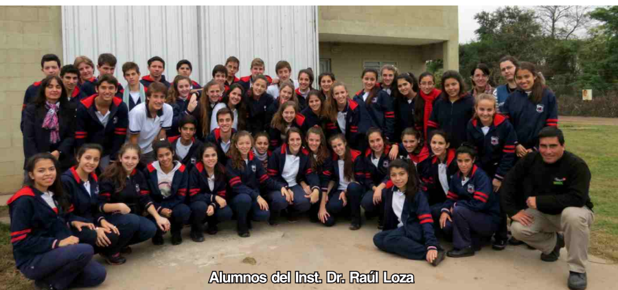
Alumnos del Inst. Dr. Raúl Loza