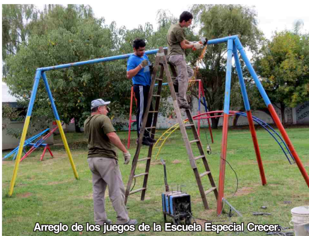
Arreglo de los juegos de la Escuela Especial Crecer.

comenzados a fin del año pasado: refaccionar los juegos del patio (soldarlos, lijarlos y pintarlos).