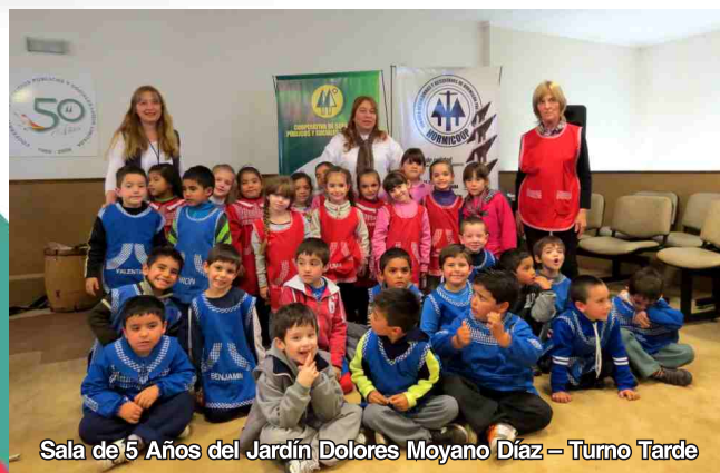
Sala de 5 Años del Jardín Dolores Moyano Díaz – Turno Tarde